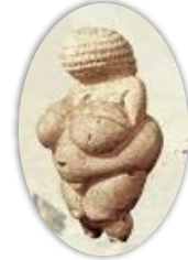
Imagen de una Venus Paleolítica: