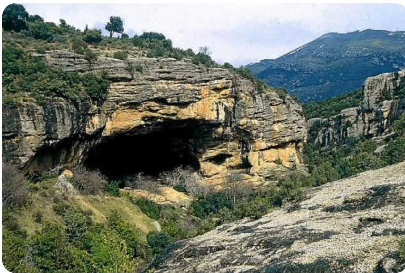
Entrada a la Cueva de Chaves.

En Cueva de Chaves se descubrió algo muy importante: el enterramiento de un niño, que estaba dentro de una fosa y tenía piedras pintadas con diferentes figuras.