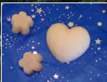
Trabajos navideños Centros Especiales de Empleo