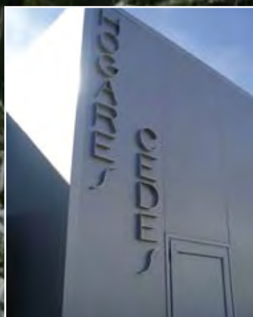
Premios de Arquitectura García Mercadal y Ricardo Magdalena