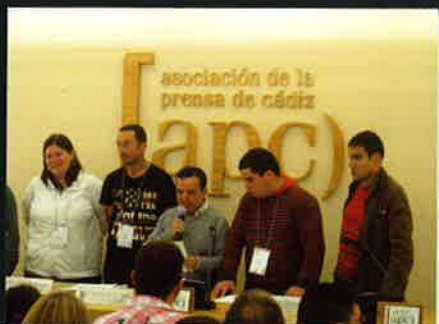
Aragoneses con discapacidad intelectual discuten acerca de la evolución de sus derechos