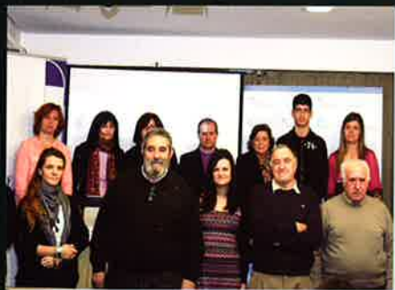
FEAPS se moviliza