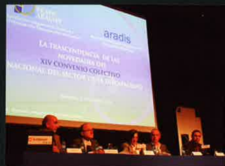
Futuro, empleo, dependencia y el nuevo convenio colectivo a través de jornadas y charlas