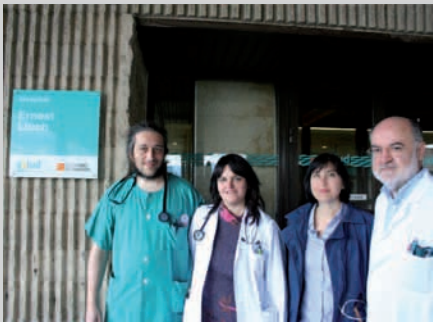
Un modelo de referencia en la atención socio sanitaria a personas con discapacidad

Asociación Aragonesa de Entidades para Personas con Discapacidad Intelectual