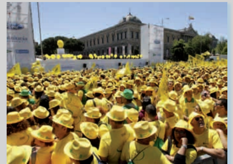
75 Aniversario ONCE