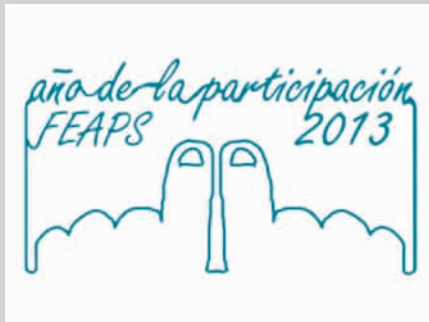
Año 2013. Año de la Participación FEAPS