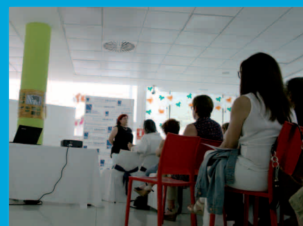
Repensando los valores de 235.000 familias de personas con discapacidad intelectual