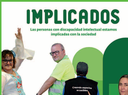
#Implicados. Lanzamos una campaña para poner el valor la implicación de las personas con discapacidad intelectual en la sociedad