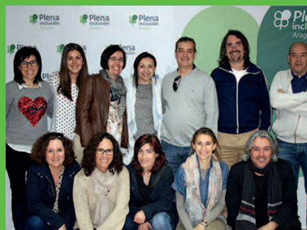
Transformación de servicios. Entidades dentro y fuera de Plena inclusión Aragón transforman sus servicios hacia cada persona