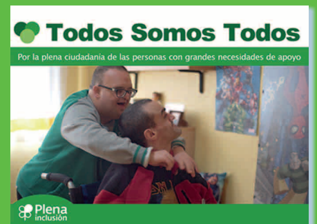
#TodosSomosTodos. Visibilizando a más de 63.000 personas con discapacidad intelectual y grandes necesidades de apoyo y sus familias