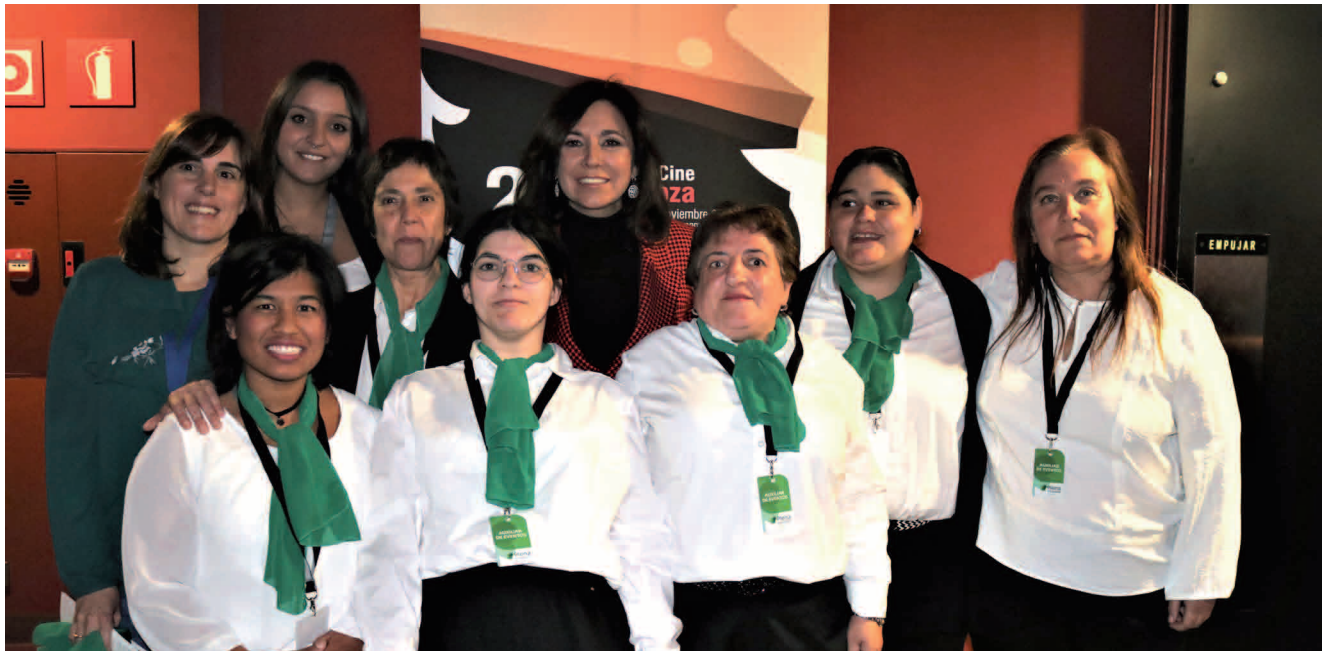
Auxiliares de eventos de Plena inclusión Aragón, junto a Isabel Gemio, en el Festival de Cine de Zaragoza.

El Festival de Cine de Zaragoza contó con la ayuda de los auxiliares de eventos con discapacidad intelectual formados por Plena inclusión Aragón, que también recibió un reconocimiento