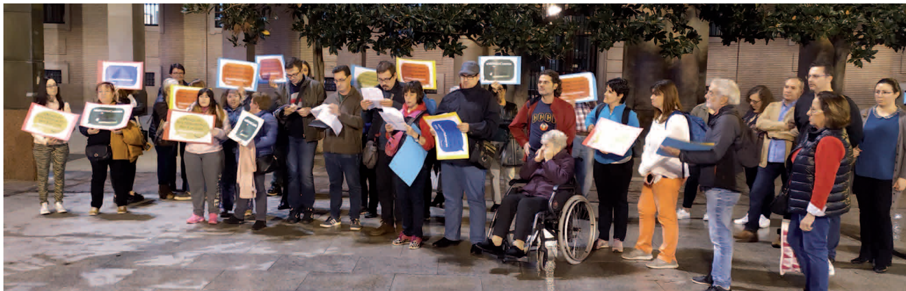
Concentración en Zaragoza para exigir unas elecciones accesibles.

Las personas incapacitadas judicialmente estrenaron en 2019 su recuperado derecho al voto, en un año en el que Aragón contó por primera vez con un colegio electoral con accesibilidad cognitiva