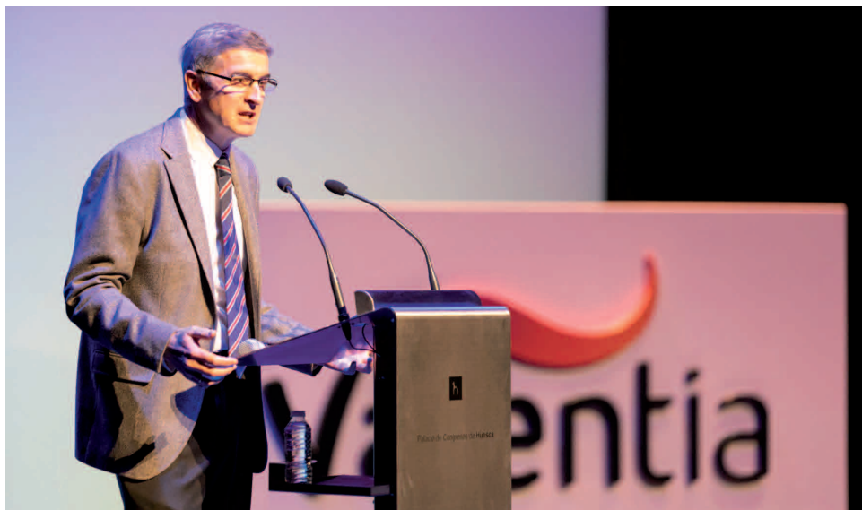
Presentación del libro de Amibil en el Teatro Capitol de Calatayud.

Atades Huesca se ha convertido en Valentia. La organización sin ánimo de lucro, referente en la provincia de Huesca, que ofrece a las personas con discapacidad intelectual y a sus familias todo el apoyo necesario para desarrollar una vida plena, adquiere una nueva identidad más positiva, abierta y flexible, nacida del compromiso y la voluntad de construir una sociedad más inclusiva y justa.