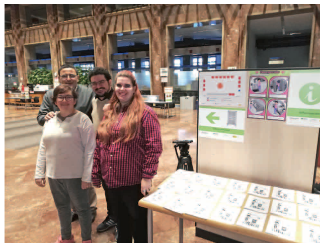
Parte del equipo que señaló el colegio electoral situado en el Ayuntamiento de Zaragoza.

Para la puesta en marcha de esta experiencia piloto, Plena inclusión Aragón contó con la total colaboración de la Junta Electoral de Zona de Zaragoza, la Delegación del Gobierno en Aragón y el Ayuntamiento de Zaragoza. Esta acción se basó en una iniciativa de la confederación de Plena inclusión España que, en coordinación con diferentes organismos públicos, logró señalar un total de 1.047 colegios electorales en Extremadura, Aragón, Castilla y León, Galicia, Murcia, Navarra y Melilla.