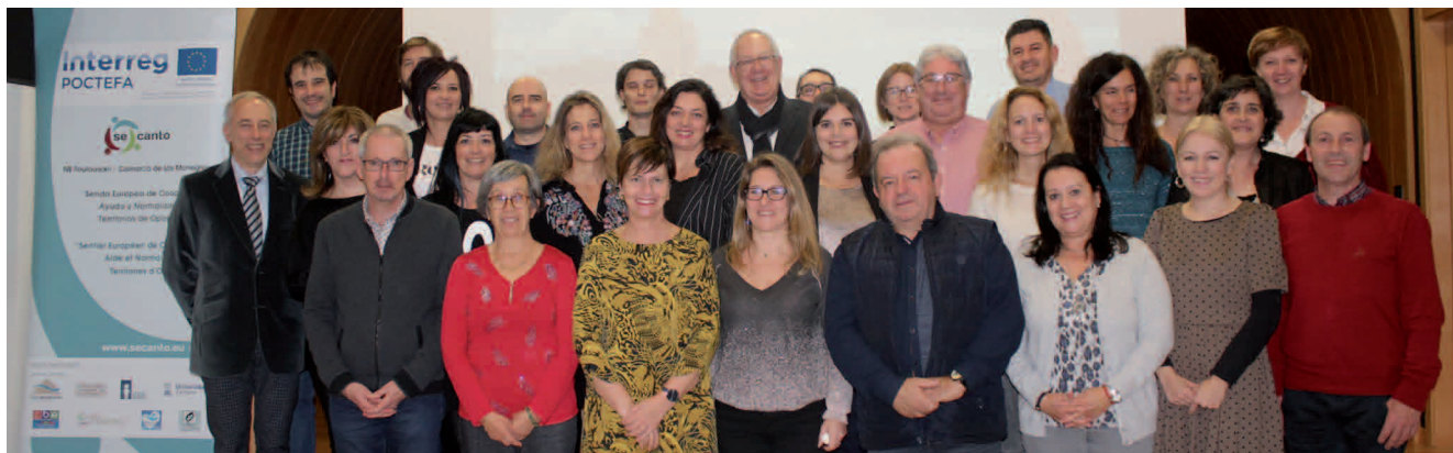
Socios del proyecto Interreg POCTEFA SE CANTO en una reunión de coordinación transfronteriza

SE CANTO (“Senda Europea de Cooperación, Ayuda y Normalización entre Territorios de Oportunidades”) se desarrolla en Los Monegros y en el Noreste Toulousain francés desde el pasado año 2018 y tiene una ejecución inicial de 36 meses.