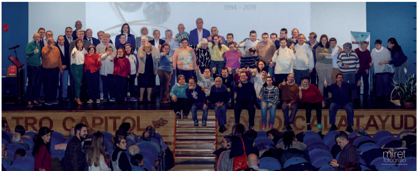
Presentación del libro de Amibil en el Teatro Capitol de Calatayud.

Antes del nacimiento de la entidad bilbilitana, todos los servicios para la discapacidad intelectual se concentraban en Zaragoza capital