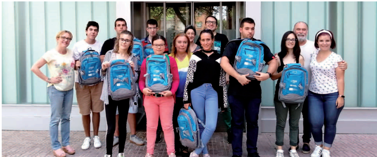
Alumnado y profesorado del curso de auxiliar de comercio.

Socios de la Federación de Empresarios de Comercio y Servicios de Zaragoza y Provincia facilitan la realización de prácticas profesionales a jóvenes con discapacidad intelectual