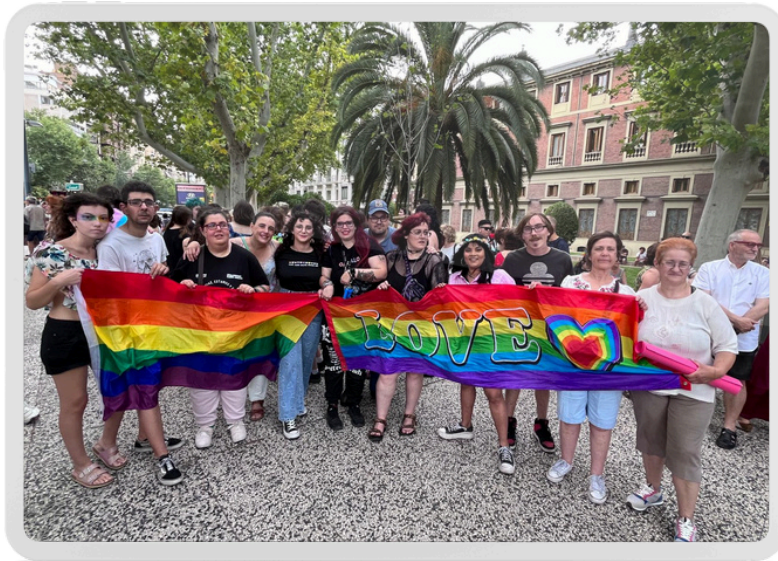
Manifestación en favor de los derechos LGTBIQ+ el día 28 de junio de 2024.