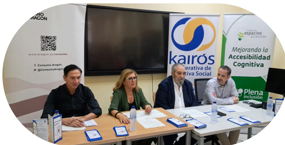
Presentación del folleto en Lectura Fácil para la Oficina del Consumidor.