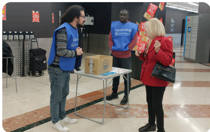
Gran Recogida del Banco de Alimentos. 22 de noviembre de 2024.

Por ello, en 2024 continuamos promoviendo la participación y contribución en diferentes causas sociales.