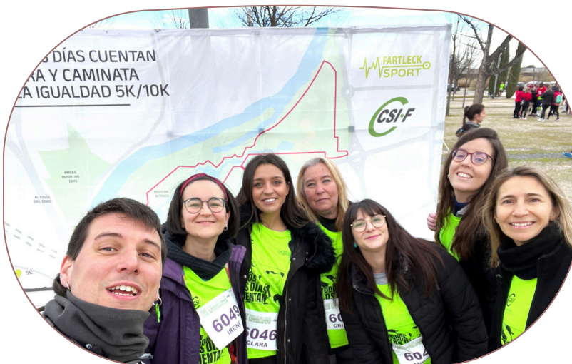
Plantilla de Plena inclusión Aragón participando en la carrera por la igualdad organizada por CSI-F en 2024.