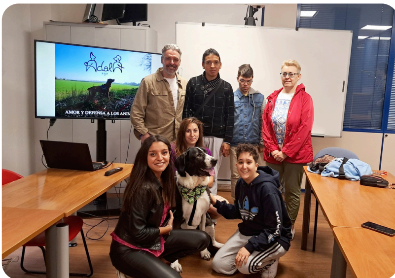
Colaboración con ADALA Zaragoza para sensibilización sobre el trabajo de las protectoras de animales y recogida de alimentos para animales del refugio.

Además, durante el 2024 se han realizado acciones como: