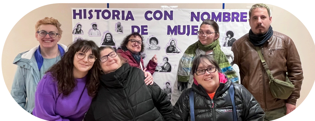
Mural realizado por personas con discapacidad intelectual con motivo del Día Internacional de la Mujer en 2024

Plena inclusión Aragón implica en sus acciones a todos sus grupos de interés, promoviendo y difundiendo la importancia de la igualdad de género.